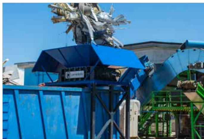
PZ 2 H 1500 shredder/Cesoia Rotante PZ2 H 1500