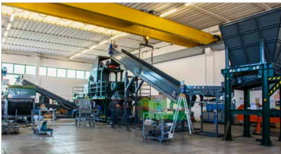
Panizzolo plant with FLEX 1000, Eddy Current SMNF 1000 and Loading Hopper PZ 1000 Impianto Panizzolo con FLEX 1000, Correnti Parassite SMNF 1000 e Tramoggia Carico PZ 1000