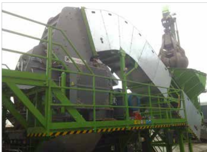
FLEX 700 Panizzolo hammermill Mulino a martelli Panizzolo FLEX 700