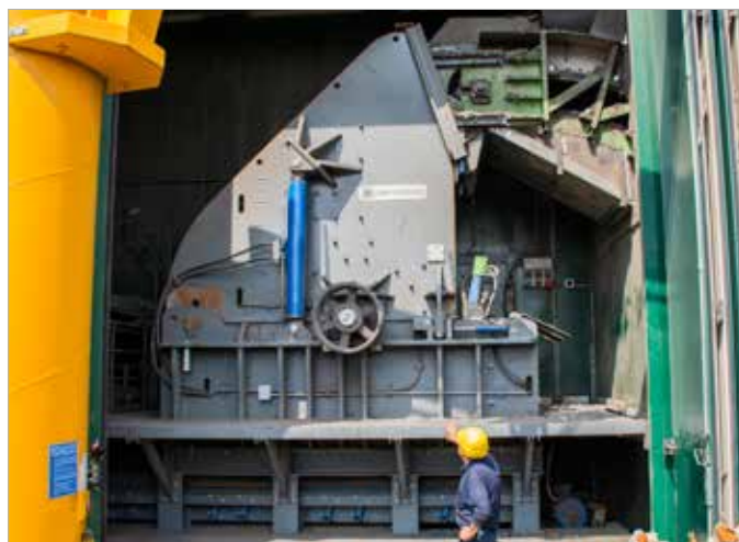
FLEX 1100 MEGA Panizzolo Hammermill Mulino a martelli Panizzolo FLEX 1100 MEGA