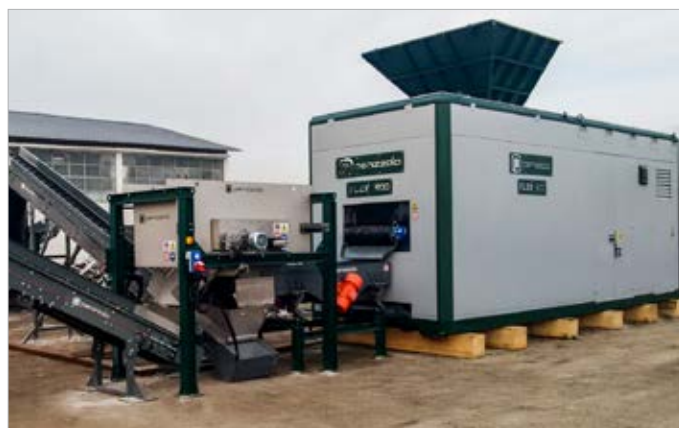
FLEX 800 Mobile