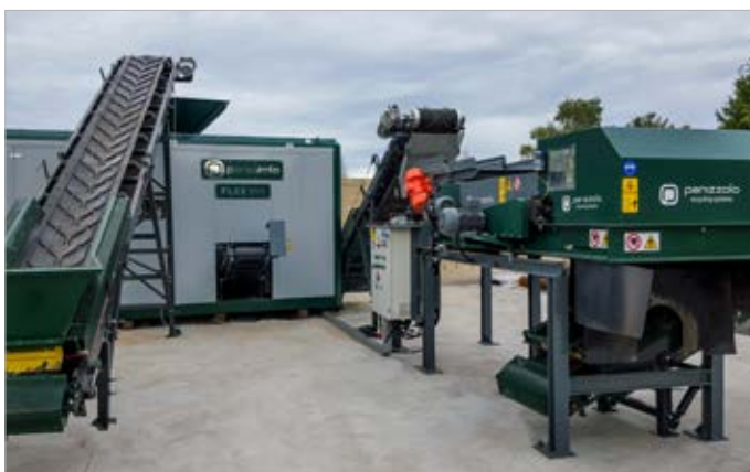
FLEX 500 Mobile + eddy current ECP